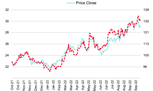
Bangkok Dusit Medical (BDMS TB)